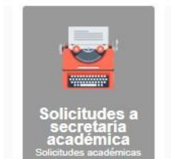
Imagen 4. Módulo “Solicitudes” del SGA Cambios y anulaciones

Las solicitudes de cambio de asignatura y/o paralelo, y las solicitudes de anulación de asignatura o de retiro del semestre se deben presentar mediante el módulo Solicitudes del Sistema de Gestión Académica, escogiendo la opción “Adicionar” y el tipo de solicitud. Cada solicitud tiene instrucciones específicas que te invitamos a seguir.