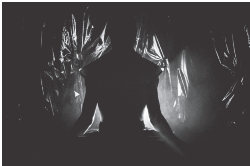
Figura 3. Escena (UHMAP)

La propuesta sonora arrastra al espectador a los arrabales de una escena callejera que es analizada por ojos de un investigador. Juega con