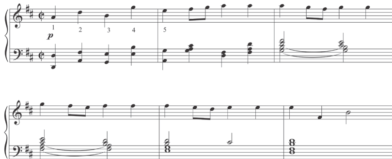
Ejemplo 9: Tercera Sinfonía . Tema principal del primer movimiento.

Es interesante observar la creatividad del compositor en el tema principal del primer movimiento, donde la serie ‘la-re-si-sol-mi’ aparece en el orden original, pero el oyente tiene la impresión de escuchar un tema nuevo porque las notas aparecen en diferentes alturas y con una nueva rítmica de carácter dancístico (Ejemplo 9).