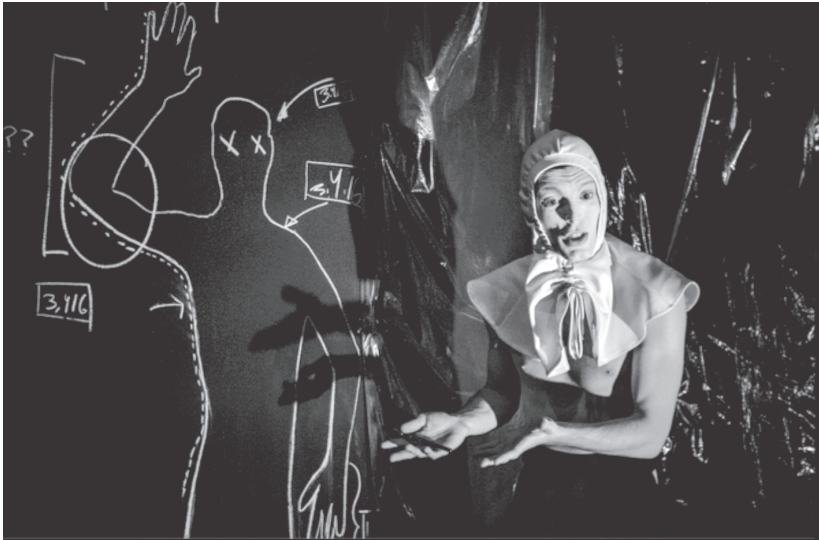
Figura 4. Escena (UHPAP)