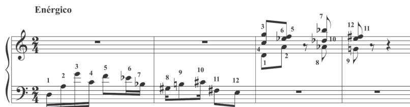
Ejemplo 6: Primera Sinfonía . Tema secundario.

Con frecuencia encontramos en sus sinfonías algunos temas formados por melodías de doce tonos, como se puede observar en el tema secundario de la Primera Sinfonía (Ejemplo 6), y en el episodio central de su Segunda Sinfonía (Ejemplo 7).