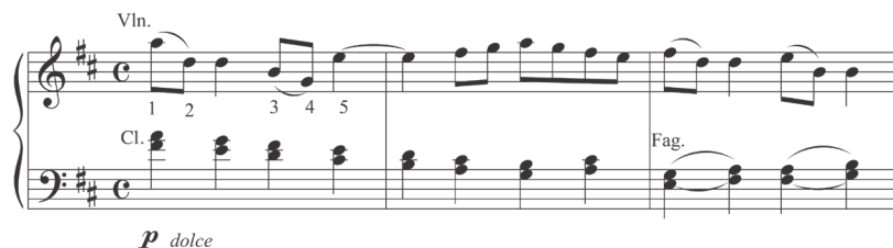
Ejemplo 10: Tercera Sinfonía. Tercer movimiento.

Lo mismo ocurre con el tercer movimiento de la sinfonía, donde la serie original aparece con la base rítmica del bourrée .