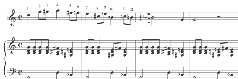
Ejemplo 7: Segunda Sinfonía . Episodio central.