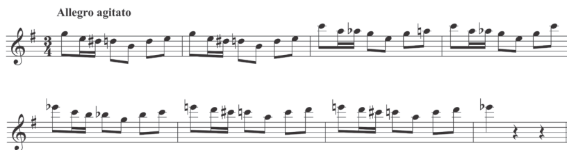
EJEMPLO 3: Suite Atahualpa . Tema del combate entre los indígenas y españoles.

Al escuchar la escena de la batalla entre los indígenas y los españoles se pueden distinguir los leitmotifs de ambos grupos, los cuales describen las etapas de la lucha con tal vivacidad que es muy fácil para el oyente visualizar la escena en su mente (Ejemplo 3). Salgado describe la victoria de los españoles con la transformación dramática del leitmotiv de los indígenas, que ahora suena acompañado por los acordes pesados de los vientos metales y el tutti de la orquesta. 8