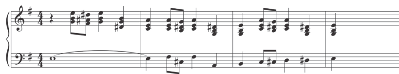
Ejemplo 2: Suite Atahualpa . Tema de los españoles.

Los temas de los españoles, en cambio, están representados con la sonoridad de los vientos metales, registros graves y melodías diatónicas armonizadas con acordes (Ejemplo 2), que contrastan con la estética musical indígena, que se caracteriza por las melodías pentafónicas y el sonido agudo de las flautas indígenas.