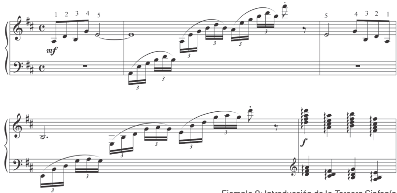
Ejemplo 8: Introducción de la Tercera Sinfonía .

transmutación de la serie (R, I, IR). 13 La introducción al primer movimiento muestra la serie de cinco tonos en su versión original en el compás #1, y en su versión retrógrada en el compás #3 (Ejemplo 9).