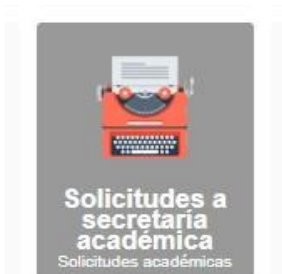
Imagen 4.- Módulo "Solicitudes" del SGA

Las solicitudes de cambio de asignatura y/o paralelo, y las solicitudes de anulación de asignatura o de retiro del semestre se deben presentar mediante el módulo Solicitudes del Sistema de Gestión Académica, escogiendo la opción "Adicionar" y el tipo de solicitud. Cada solicitud tiene instrucciones específicas que te invitamos a seguir.