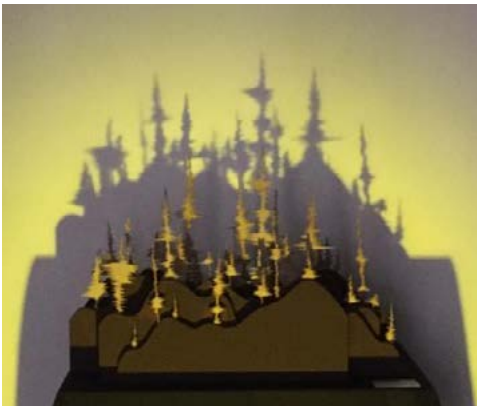
Figura 2: "Bosque de palabras".

dor una experiencia visual y auditiva, cumpliendo con la traducción de percepción sonora a visual y viceversa.