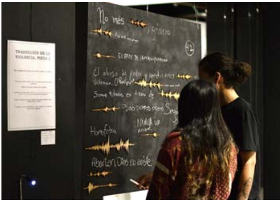
Figura 3: "Efectos lingüísticos". Foto de Johan Garrido (2019).