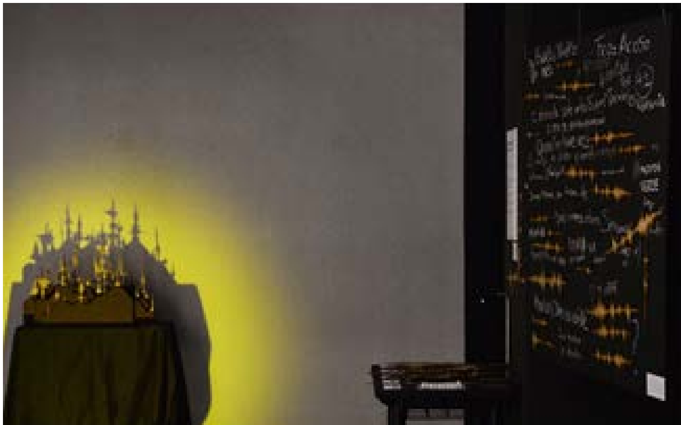
Figura 1: A la izquierda: "Bosque de palabras". A la derecha "Efectos lingüísticos".