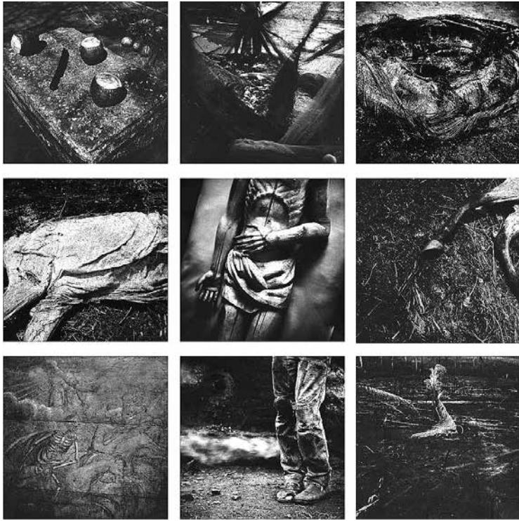
Figura 3 - RIO BRANCO, Miguel. Composición de fotografías que integran la obra Barroco/Novena (1998). Imagen extraída de la página del artista en el sitio del Instituto Inhotim. Disponible en: ( http://www.inhotim.org.br ).

La naturaleza del debate estético y las lecturas míticas que conciernen a los principios del arte barroco recorren buena parte de la obra de Miguel Rio Branco, realizando de diferentes maneras un pacto entre la producción del artista y las inferencias críticas suscitadas por el atractivo histórico y religioso de un estilo profundamente marcado por su presencia en el contexto artístico y cultural brasileño. En la obra Barroco/Novena (1998), el montaje consecutivo de seis fotografías que expone la relación entre lo sagrado, la muerte y la belleza degenerada de las formas amparadas en el cuadro de privaciones impuestas a la sociedad brasileña apunta a una alteración de las figuras de lenguaje del barroco, de modo que, en la producción de su sentido comparado, se consigna la posibilidad de ampliar el debate estético / político resultante de la apropiación de los arquetipos religiosos y de los demás elementos que caracterizan el estilo. En Hell's diptych o Díptico do Inferno (1993-1994), la analogía formal entre la foto de un trapo de tejido doblado y una pintura de cuño dantesco designa la existencia, en la obra de Miguel Rio Branco, de una función demoníaca semejante a la manera como el