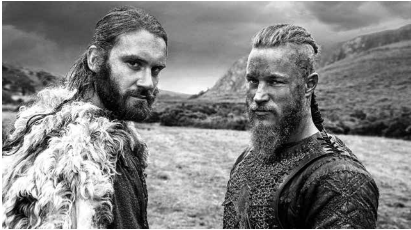
Fotograma de la serie de televisión Vikings , creada por Michael Hirst en el año 2003.