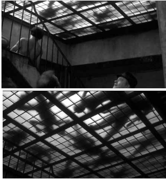
Figuras 1a y 1b: Missing [ Desaparecido ] (Costa Gavras, 1981)