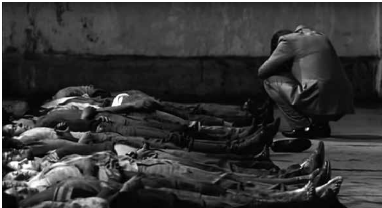
Figura 4: Tlatelolca, verano del 68 (Carlos Bolado, 2013)

La representación del horror es aquí objetivable y no constituye en sí un elemento excesivo imposible de mostrar a través de recursos fílmicos (travelling y profundidad de campo). No deja sin embargo de ser cuestionable la falta de indicios que señalen que de esa masacre no se conoce el número exacto de víctimas y, por lo tanto, la parte excesiva de dicho evento. Existe entonces una actitud indulgente respecto al crimen cometido por el Estado mexicano. El hecho de desplazar la escena del duelo de las madres de la película de Leobardo López Aretche hacia el “duelo” del funcionario público confirma además que lo que está en cuestión no es solo el rol del Estado sino su arrepentimiento. Igualmente, el rol típico del personaje femenino, el reconocimiento de la víctima, es aquí remplazado por el rol de un funcionario del Estado, haciendo de éste el mediador entre los vivos y los muertos. Por un efecto de sustitución (el funcionario en vez de la mujer y la madre) y de