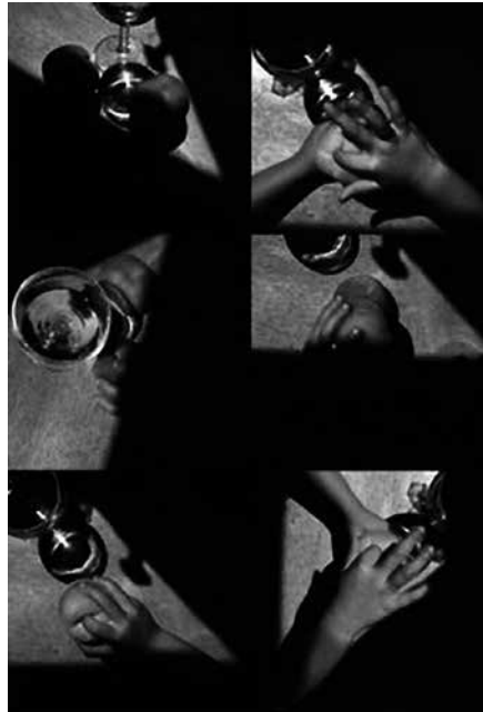
Figura 2 - RIO BRANCO, Miguel. Composición de fotografías que integran la obra Pêssegos (1994).

tinuidad del ser llevada a cabo, sistemáticamente más allá del mundo inmediato, aquello que designa las posibilidades de un enfoque religioso dado al erotismo, como algo que constituye una búsqueda por el amor divino. Aquí podrían ser lanzadas infinitas reflexiones dedicadas a los aspectos teológicos del éxtasis de Santa Teresa de Ávila, como bien definidos por Jacques Lacan en su vigésimo seminario 6 , o por el propio Bataille, en la obra en cuestión. Sin embargo, el presente análisis se detiene en lo que hace del dominio del erotismo, el dominio de la violencia, de modo que ambas categorías se destituyen del deseo de asegurar una supervivencia del hombre en un tipo de discontinuidad, temporalmente y dogmáticamente herméticas, como pretende Walter Benjamin. Tales conceptos operan, pues, como una negativa al terreno de la teología positiva que, de acuerdo con Bataille, tiene como doble, una teología negativa fundada en la experiencia mística que quiere, por fin, rechazar la apertura a la continuidad ininteligible e incognoscible, en que la muerte es el secreto mismo del erotismo.