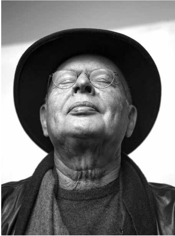
Miguel Rio Branco (1946).