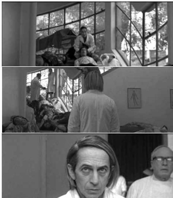
Figura 2: Santiago 73 , Post mortem (2010), Pablo Larrain.