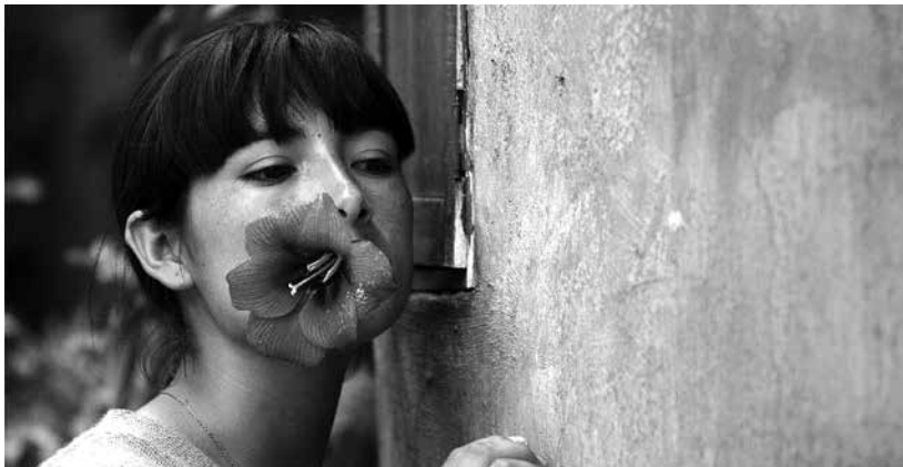
La teta asustada (Claudia Llosa, 2009).