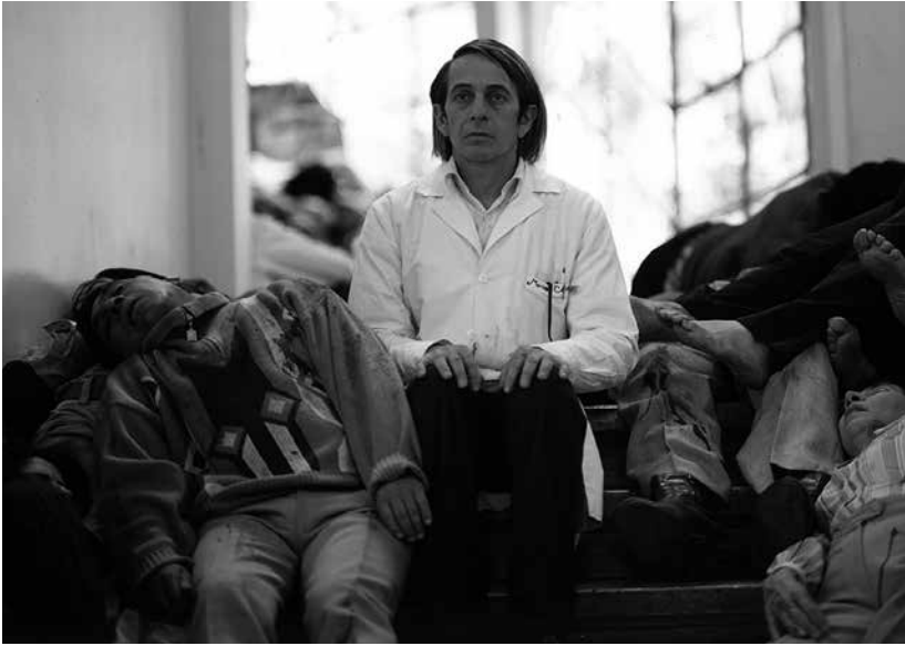
Post Mortem (Pablo Larraín, 2011).