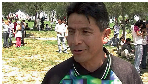
Imagen 2: migrante entrevistado en Casa de Campo: un pedacito de mi tierra .