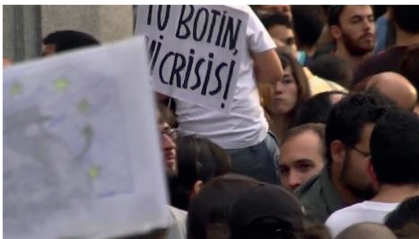
Imagen 5: marchas en Sueños hipotecados .