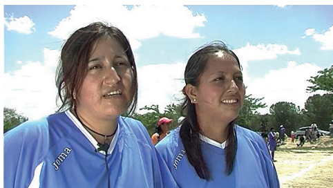
Imagen 1: fotograma de Casa de Campo: un pedacito de mi tierra .

Una vez terminada la secuencia de montaje inicial, el documental muestra los testimonios recogidos por los migrantes. Estos parten de preguntas como ¿quiénes son?, ¿a qué se dedican?, o ¿dónde se encuentran? Estas interrogantes permiten a los entrevistados presentarse e indicar su contexto actual.