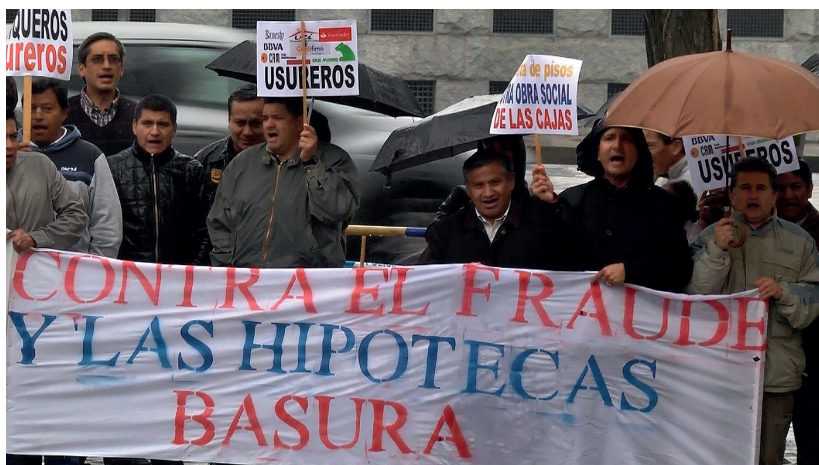
Fotograma de la trilogía Casa de Campo , de Pablo Vargas.