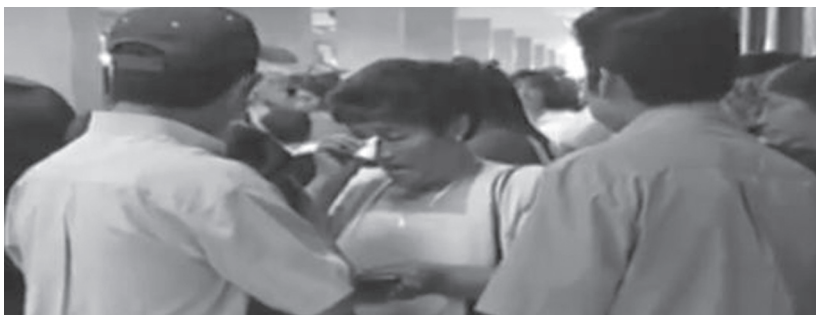
Imagen 4: introducción de Sueños hipotecados .

vez, esta técnica de la voz en off guía al espectador a través de los eventos y conceptos clave, facilitando una comprensión más profunda de la complejidad del fenómeno y su impacto.