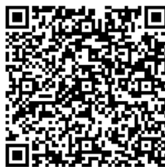
Figura 5: código QR de las partituras de Frenesí .