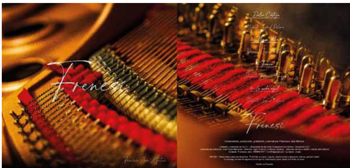
Figura 3: portada y contraportada del EP Frenesí . Daniel Jara.

Como resultado de este registro también se creó la portada y contraportada de Frenesí (figura 3):