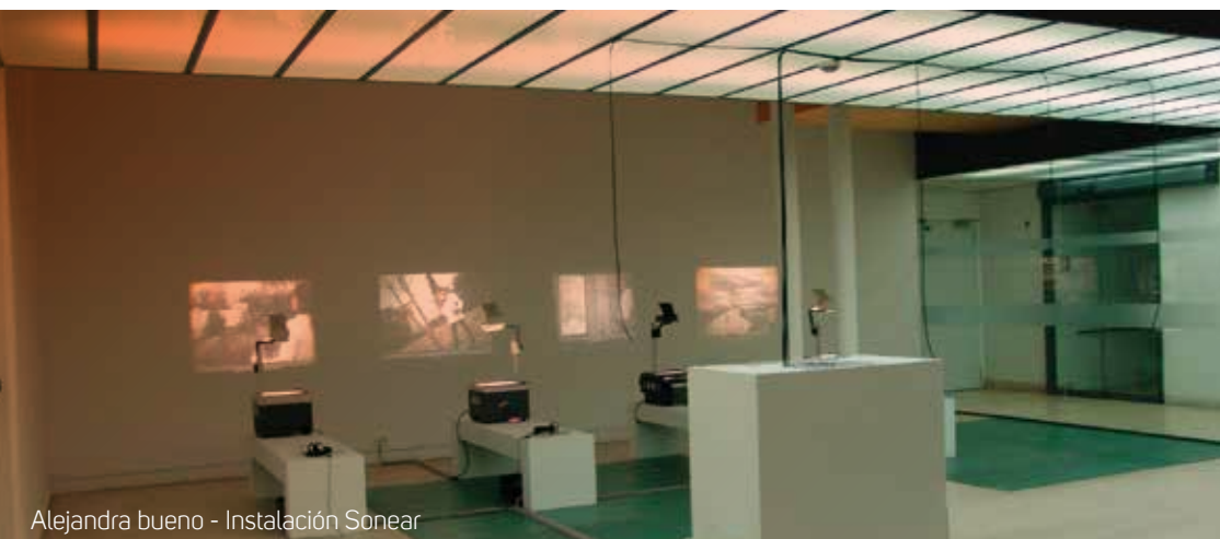
Alejandra bueno - Instalación Sonear

Las modalidades de pago son depósito, transferencia bancaria o tarjeta de crédito (Visa o Mastercard).