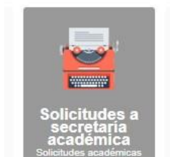
Imagen 4. Módulo “Solicitudes” del SGA Cambios y anulaciones

Las solicitudes de cambio de asignatura y/o paralelo, y las solicitudes de anulación de asignatura o de retiro del semestre se deben presentar mediante el módulo Solicitudes del Sistema de Gestión Académica, escogiendo la opción “Adicionar” y el tipo de solicitud. Cada solicitud tiene instrucciones específicas que te invitamos a seguir.