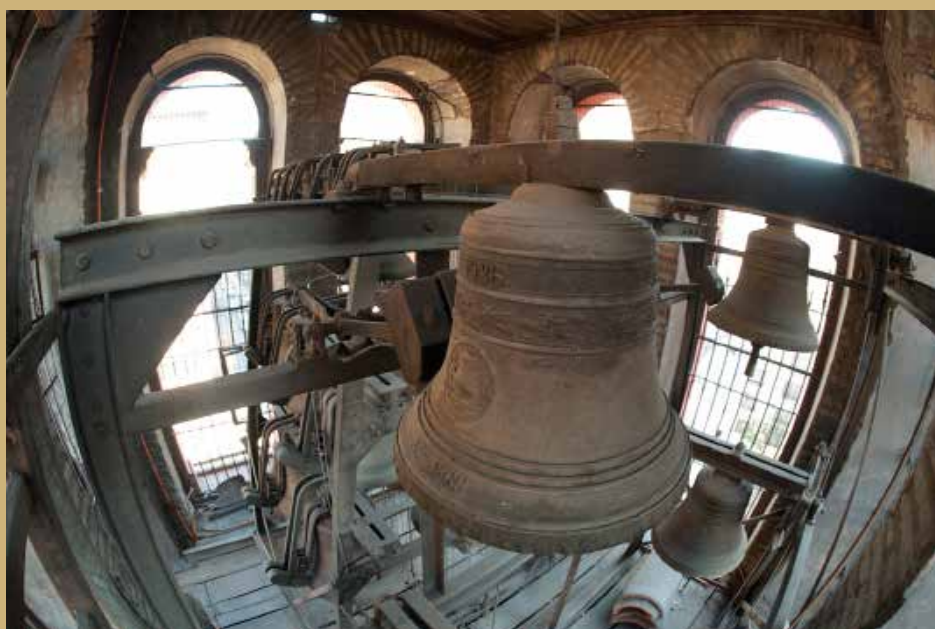
Vista general del carillón de la Basílica de la Merced.