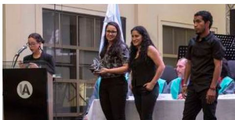
El comité organizador de InterActitos fue reconocido por su aporte a la gestión y producción artística.