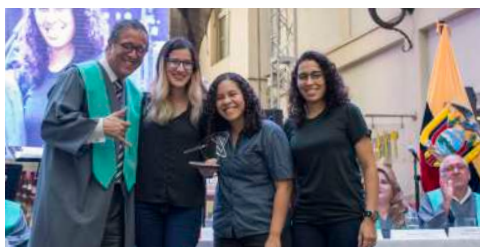
De la comunidad estudiantil, en la graduación la UArtes reconoció el aporte a la gestión y producción artística del Colectivo ADA.