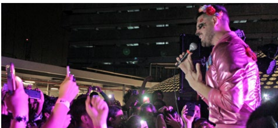
Tres imágenes de las varias actividades que se han desarrollado en la Biblioteca de las Artes, desde Interactitos hasta conciertos.